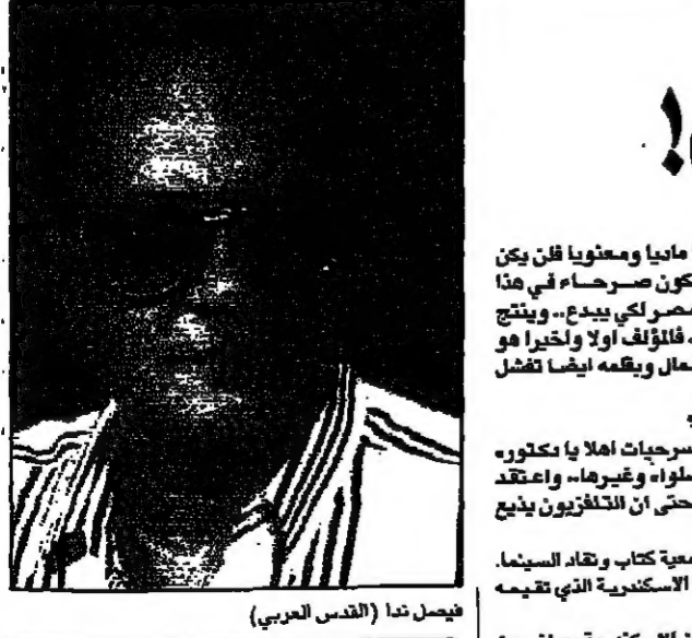
فيصل ندا (القديس العربي)